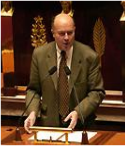
Michel Bouvard en pleine intervention à la tribune de l'Assemblée Nationale.