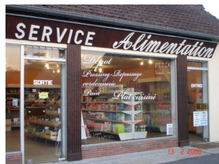
Le commerce relais, avenir du service public en milieu rural.

De la même manière, suite aux démarches engagées par Michel Bouvard, le secrétaire d'Etat chargé du Commerce, de l'Artisanat, des Petites et Moyennes Entreprises, du Tourisme, des Services et de la Consommation, vient de l'informer de l'attribution d'une subvention de 235 420 euros pour la création d'un équipement de restauration et multiservices à Saint-Pierre-de-Belleville, sur les crédits du FISAC votés par l'Assemblée Nationale ■