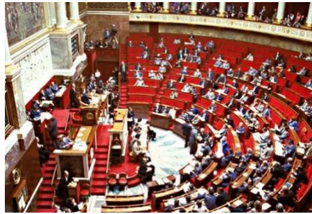
L'Assemblée nationale délibère pour faire face à la crise récente de l'euro.