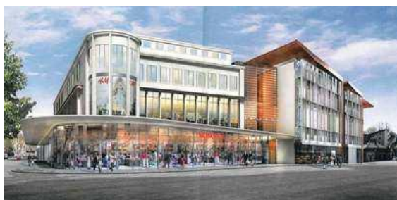
Le projet des halles de Chambéry (image de synthèse – GTM Bâtiment et Génie Civil Lyon).

Dans le cadre du Contrat Territorial Savoie (CTS) signé avec Chambéry Métropole, le Conseil général de la Savoie vient d'engager l'attribution de plusieurs subventions pour des aménagements urbains dans l'agglomération chambérienne.