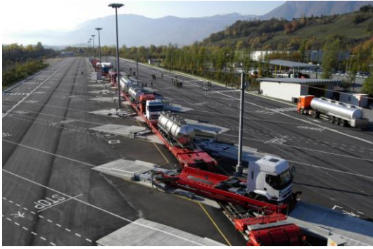
Le terminal d'Aiton-Bourgneuf en Maurienne charge chaque jour de nombreux camions.

Les gouvernements français et italiens ont engagé la procédure d'appel d'offre pour la nouvelle phase de développement de l'autoroute ferroviaire alpine (AFA), qui verra la création d'une nouvelle plate-forme de chargement des camions ou des remorques sur le rail pour franchir les Alpes, en complémentarité avec celle d'Aiton-Bourgneuf, et une augmentation des fréquences rendue possible par l'achèvement des travaux de mise au gabarit GB1 du tunnel historique du Mont-Cenis.